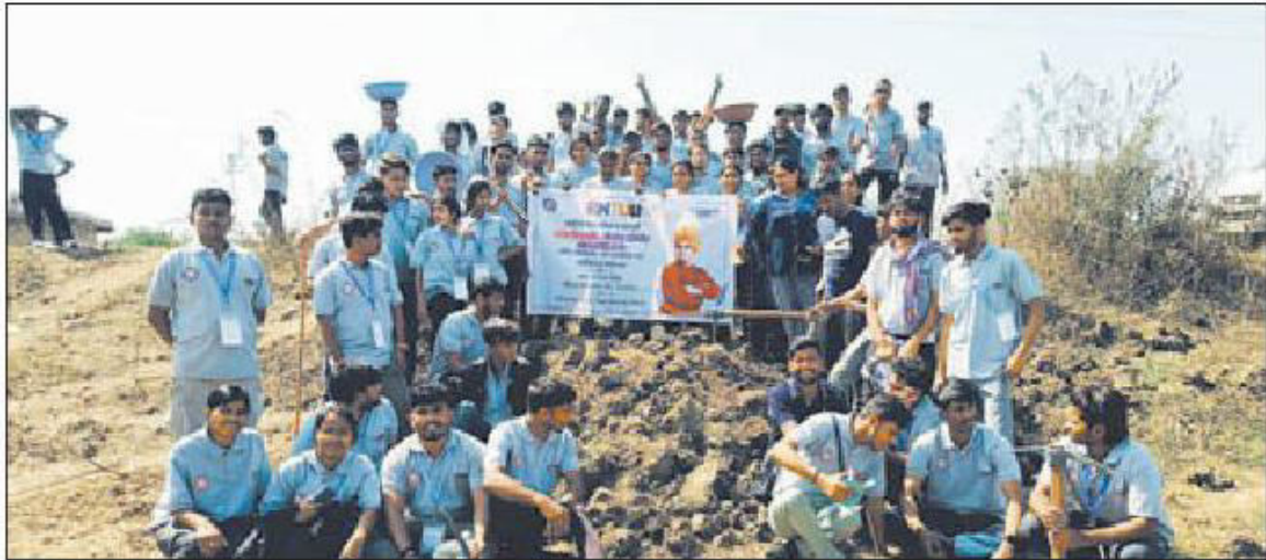
NSS Volunteers during the camp.