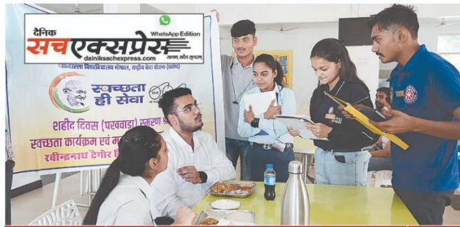
क्विज व पोस्टर मेकिंग कॉम्पीटिशन का भी हुआ आयोजन