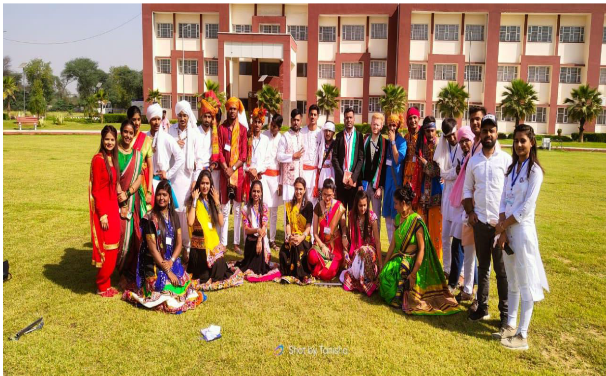
RNTU's NSS Volunteers have regular and active participation in National Integration Camp.