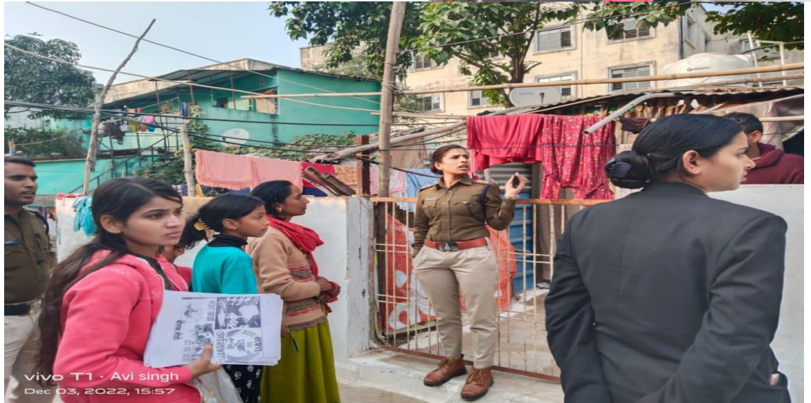
Information on de-addiction given door to door