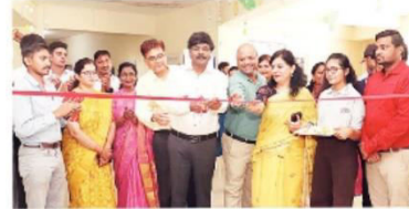
स्वदेश संवाददाता, भोपाल

जिला निर्वाचन पदाधिकारी भोपाल के निर्देशानुसार राष्ट्रीय सेवा योजना प्रकोष्ठ वरकटउल्ल विश्वविद्यालय के समन्वय में रबीन्द्रनाथ टैगोर विश्वविद्यालय के एन एस एस स्वयंसेवकों द्वारा भोपाल जिले में सी प्रतिशत मतदान कराने हेतु विभिन्न रचनात्मक गतिविधियों का आयोजन किया जा रहा है। इसी क्रम में विधि के वाणिज्य संकाय के साथ परिसर में